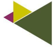
Schéma des parcours de formation possibles :