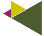
Schéma des parcours de formation possibles :